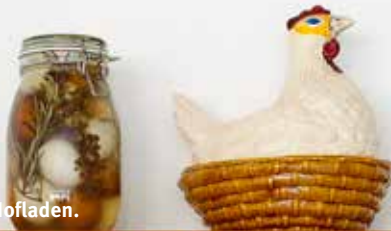
Ein Regalfach im Hofladen.

Zusammen mit der benachbarten Hochschule wurden Pappeln und Weiden zwischen den Ställen gepflanzt. Diese schnellwachsenden Hölzer dienen in erster Linie dem Schutz der Hühner vor Greifvögeln. Denn kein Huhn wagt sich aus dem Stall in ein offenes Gelände ohne Schutz. Inner- und außerhalb der Ställe herrscht betriebsames Gegackere. Die Tiere sind sehr beschäftigt und auch wenn man ihnen näher kommt, lassen sie sich nicht aus der Ruhe bringen. In den Ställen befinden sich reichlich Sitzplätze- und Legenester für alle. Nachdem alle einen Übernachtungsplatz gefunden haben, wird der Stall nachts zum Schutz der Tiere geschlossen. 2013 wurde dieses einmalige und vollständig selbst entwickelte Stallkonzept vom Land Baden-Württemberg mit dem Tierschutzpreis ausgezeichnet. Dem ist nichts hinzuzufügen. Außer vielleicht: dass wir den Hut vor den Schneidern ziehen und froh sind, so tolle Produkte vermarkten zu können. – MICHAEL SCHNEIDER