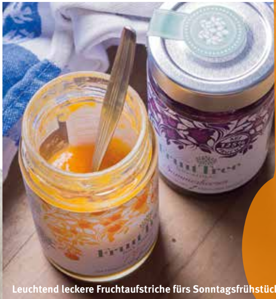
Leuchtend leckere Fruchtaufstriche fürs Sonntagsfrühstück.