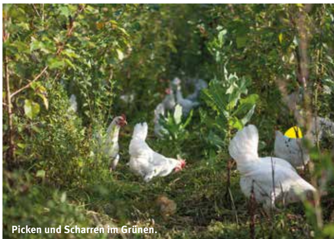
Picken und Scharren im Grünen.